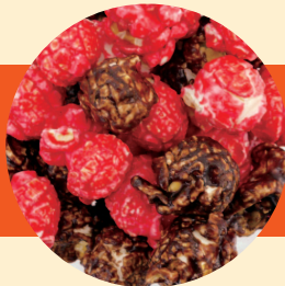
ストロベリー × ショコラ