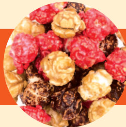
ストロベリー × ショコラ × キャラメル