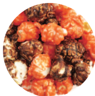
ショコラ × ホワイトチョコ (オレンジ)