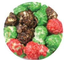
ショコラ × ホワイトチョコ (緑) × ストロベリー