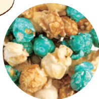
キャラメル × ホワイトチョコ (白) × ホワイトチョコ (青)