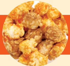
キャラメル × チーズ