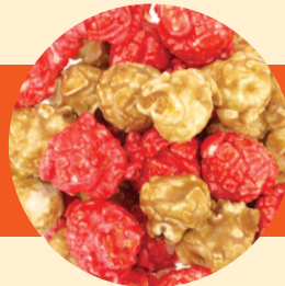
イチゴ × キャラメル