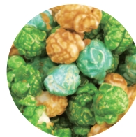
キャラメル × ホワイトチョコ (青) × ホワイトチョコ (緑)